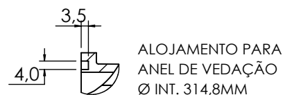
DETALHE A ESCALA 2 : 5